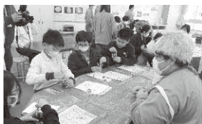
はじめに水溶液に色をつけたよ

次に、色のついた水溶液をスポイトで乳酸カルシウム水溶液の中にポタポタといくらの形になるように慎重に水滴の量を考えながら落としていきました。