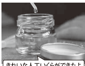
きれいな人工いくらができたよ

この日の実験で作った人工いくら、ふしぎ探検隊の皆さんが用意してくださった小瓶に入れてお土産として持ち帰りました。