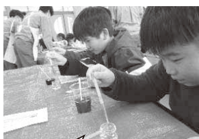
スポイトで水溶液を混ぜたよ

すると、なんとということでしょう。乳酸カルシウム水溶液の中にカラフルな色のついた、本物そっくりのいくらのような球形の固まりができていきました。